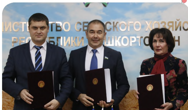
Подписано Отраслевое соглашение по АПК Республики на 2019-2021 годы