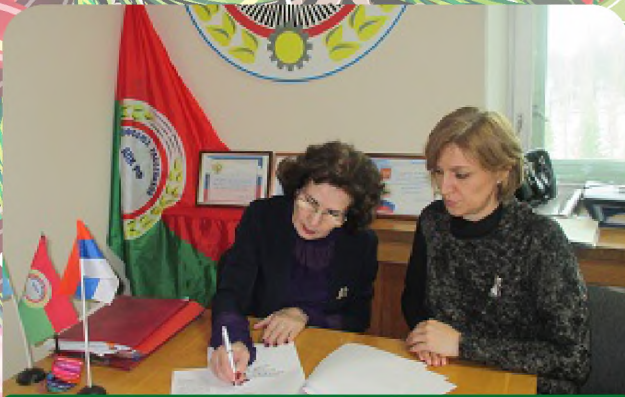
Подписание колдоговора в АО «Башспирт»