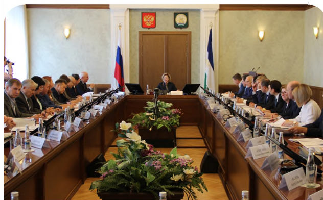
Заседание республиканской трехсторонней комиссии