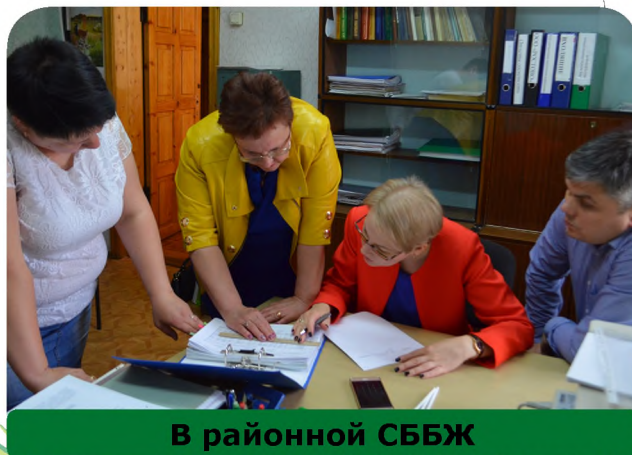
В районной СББЖ

рядка 19 176 рублей у основного персонала и 24 000 у руководителей служб, также отсутствует дифференциация в оплате между квалифицированным и неквалифициро-